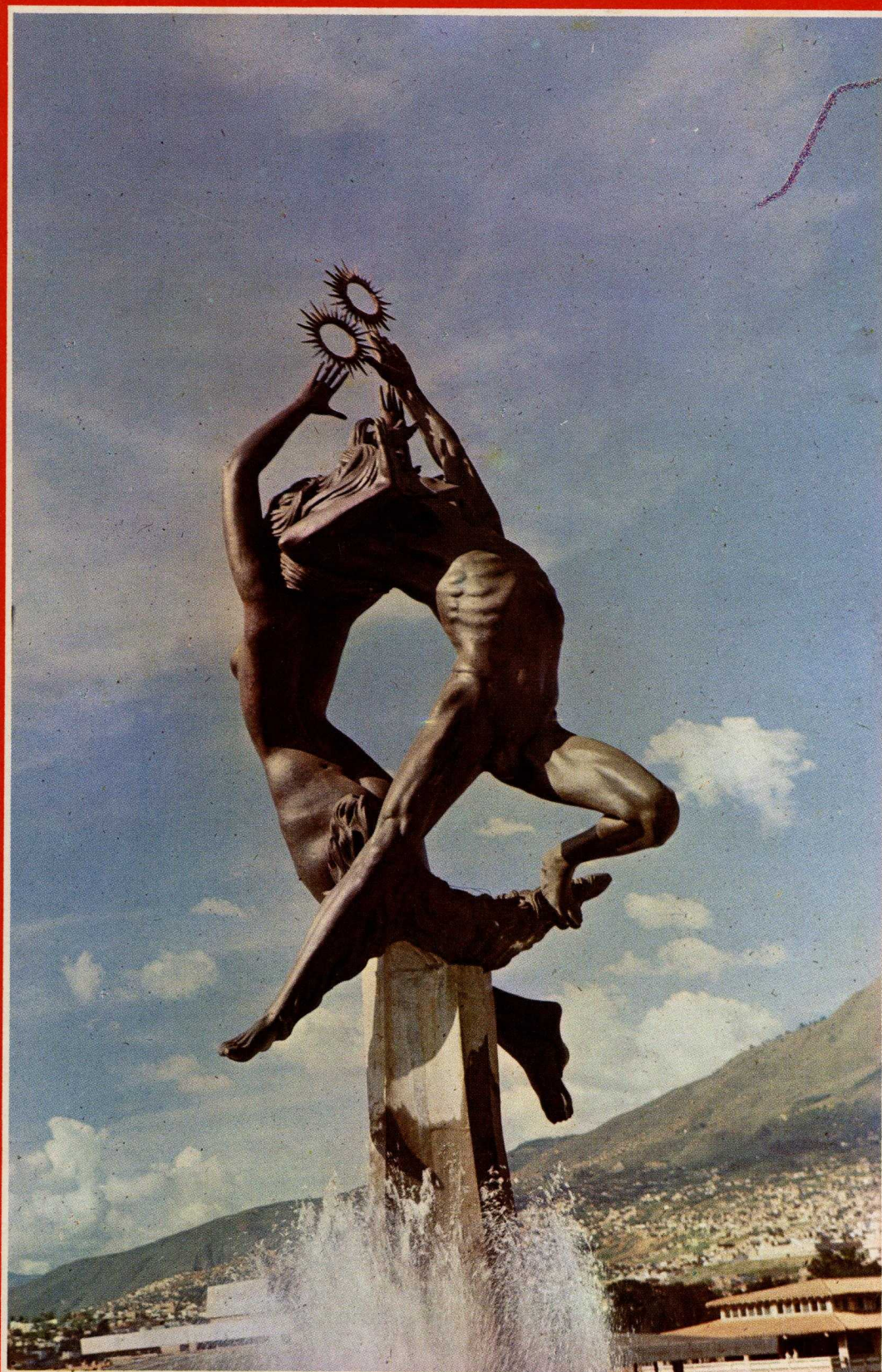
HOMENAJE A LA JUVENTUD Y A LA UNIVERSIDAD